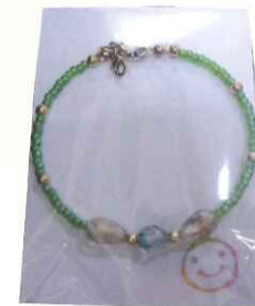
マスククリップ 300円～

お子様用からアダルト&シニア様向け高級ビーズ使用でのオーダーもお受け致しております。