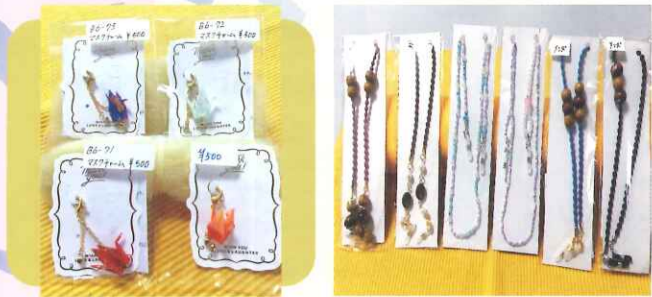
マスクチャーム各500円 マスク&メガネストラップ各1,000円