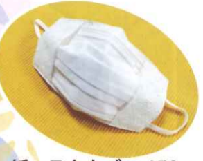
紙マスクカバー 450円

紙マスクカバーは紙マスクではお肌が荒れてしまう方に直接マスクが触れないようにする商品になります。またリパーシブルですので紙マスクでもかぶれないという方は紙マスクを内側にして布マスクのようにおしゃれにお使いいただくことも可能です。