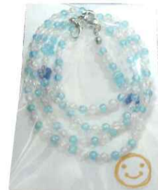
マスクストラップ 500円～

ご購入は…あつたかホール『喫茶ほほえみ』【八王子市北野町596-3 北野余熱利用センター2F】 『すまいる実験室』【八王子市打越町2001-9 北野レインボービル1F】