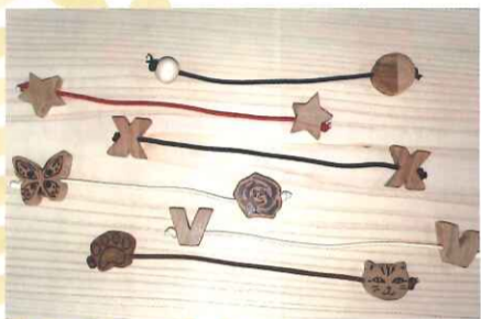
快適 マスクフック 各450円

マスクのヒモをひっかけます。耳の負担が軽減されるので、メガネや補聴器を使う方にもおすすめです。