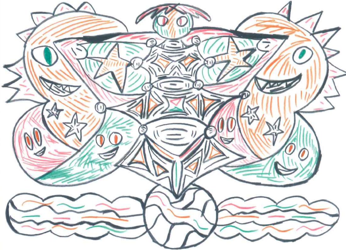
絵:「賑(にぎやか)」あまは みのり (特定非営利活動法人しあわせのたね)

八王子ワークセンターは 障害のある人たちの地域生活を ワーク(働く)の視点から 支援しています。