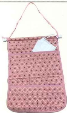
マスクラック各種 1,500円

ご購入は…デイサービスTRY マスクケースは、『イタリアンレストランふもとや』『ごまごころ権現茶屋』『おおりの家』でも販売しております。