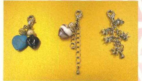
マスクチャーム 各300円