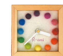
↑フェルトボールの時計は額も手づくり!