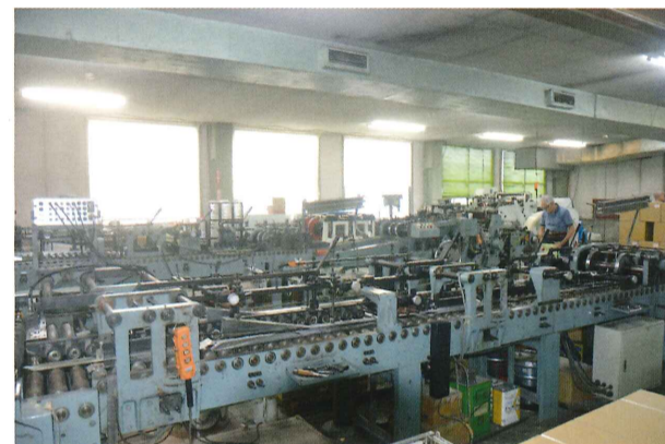
工場には長い機械が3台。ひとりで1台を操作します