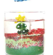
↑カラフルでかわいいジェルキャンドル