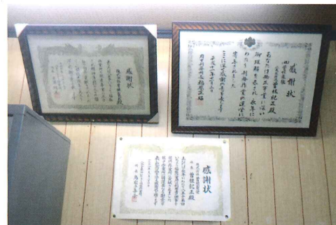
事務所に飾られた感謝状

株式会社曾根製袋は、紙袋を製造する会社です。社名等が印刷された紙を機械に通し、紙袋の形に加工しています。その後、紙袋に持ち手を取り付ける作業を福祉作業所などに発注しています。