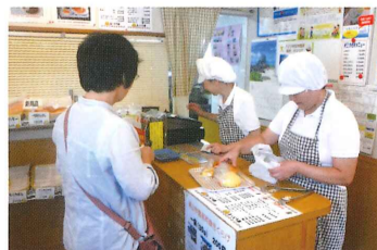
↑接客も楽しい仕事のひとつ