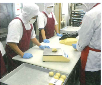
↑きっちりと測ってクルクルと丸めます

ふっくら亭のパンは、お店のほかに『道の駅八王子滝山』『東京天使病院売店(上巻分方町50-1・月~金、10:30~)』『永生病院売店(桐田町583-15・月~金)』などをはじめ、地域のお祭りやイベントなどでも販売しています。もちろん、評判は上々だそうですよ。