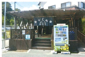
↑風が気持ちいいテラス席は16席