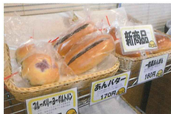
↑人気の新商品「あんバター(170円)」

←ホテルブレッド。食パン(1斤220円)もあります。どちらもお好みの厚さにスライスできます。