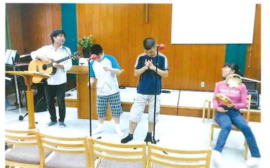
↑音楽活動。それぞれが得意な楽器を担当します