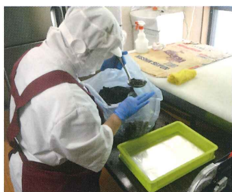
↑レーズンを小分けに袋詰めします