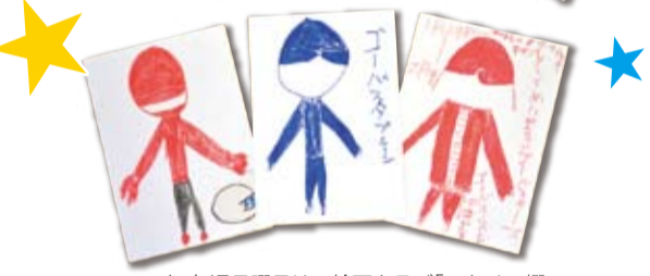
↑毎週日曜日は、絵画クラブ「アトリエ響」で、絵を描いています。