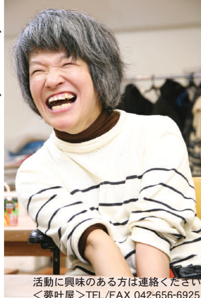
活動に興味のある方は連絡ください ＜夢叶屋＞TEL/FAX 042-656-6925