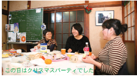
この日はクリスマスパーティでした