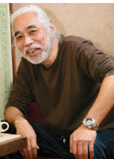
かてかて7号～9号（次号までの表紙作品を提供していたいたリンデン氏。

その他、都心の美術館へでかけたり、カラオケやダンスをしたり、全身を動かしながらいろいろな感覚を刺激する機会をつくっています。音楽好きな人も多く、ギターや弾き語りをはじめます。アートの時間では、それぞれが思い思いの好きなように感覚を動かせることで、その人らしい作品が生まれています。ときどきだれかの悩み相談から盛り上がり、飛び出した名言・迷言も数々。毎年開く作品展のタイトルも多数決で決めます。今年のタイトルもカッコイイです。パオパオパーティでは弾き語りやキーボードとチェロ演奏、ものまね、詩の朗読、ダンスなどの発表もあります。ぜひ作品展に足を運んでみてください！！