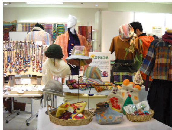
そごう八王子店「八王子フェスティバル」出店