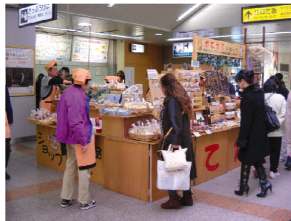
JR八王子駅券売機前出店

一般企業での就労が困難な方に、働く 場を提供するとともに、知識及び能力 の向上のために必要な訓練を行います。